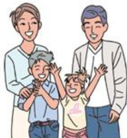
ご家族の健康が気になりました方