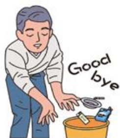
禁煙することを希望している方