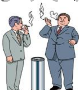
10年以上の喫煙歴がある方