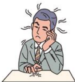
やめたくてもなかなかやめられない方